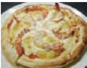
エビと玉子のタルタルピッツア ¥980