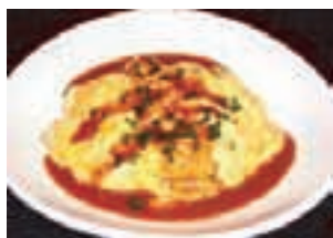
特製オムライス ¥800 ランチタイムの人気者です。 ふわふわとろとろの卵が絶妙！