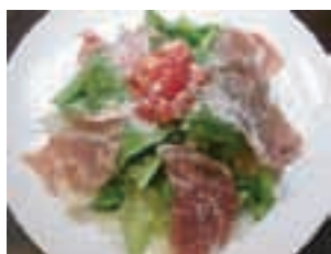
山盛りルッコラと生ハムの イタリアンサラダ ¥630