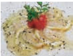
ホタテの地中海マリネ ¥580 新鮮な生ホタテをレモンのソースでさっぱりと仕上げました！