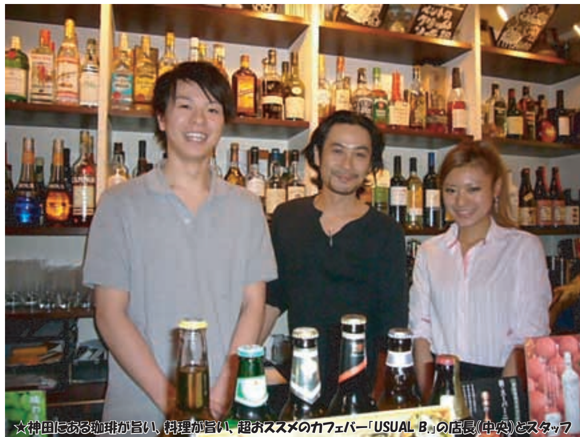
★神田にある珈琲が旨い、料理が旨い、超おススメのカフェバー「USUAL B.」の店長(中央)とスタッフ

「珈琲茶房 と庵」の行き方は京成鬼越駅から徒歩15分程 住所：千葉県市川市本北方1-44-20 電話：090-1552-6434