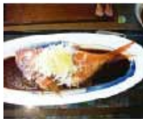
キンメの煮魚は美味でした！