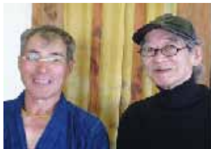
ご主人（左）と楠木マスター

と庵の豆を使った珈琲と美味しい手打ち蕎麦、それに何といてもこの素晴らしい眺望と日本庭園、豪華な作りが自慢の「夢宝庵」に行ってきました。