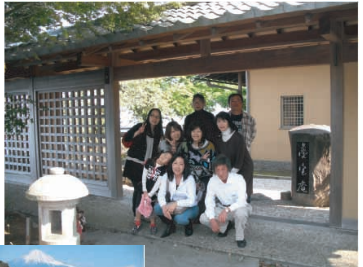
★静岡県焼津にある素晴らしいお蕎麦屋さん「夢宝庵」にて

「珈琲茶房 と庵」の行き方は京成鬼越駅から徒歩15分程 住所：千葉県市川市本北方1-44-20 電話：090-1552-6434