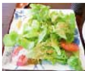
新鮮サラダがたっぷり！