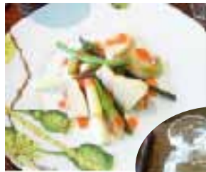
美しい盛り付けも、