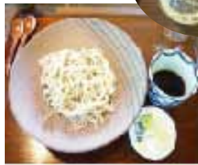
細打ちでしなやかなお蕎麦も大満足でした。